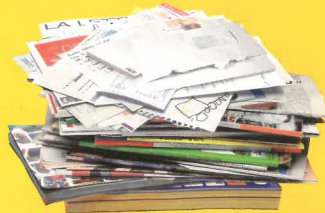
journaux / magazines prospectus / catalogues cahiers / feuilles enveloppes