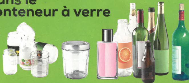
pots / bocaux / flacons / bouteilles