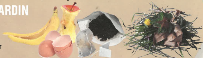
épluchures, coquilles d'œuf, filtres à café, thé, feuilles, fleurs...

- NE PAS METTRE viande, os, poisson, litière d'animaux