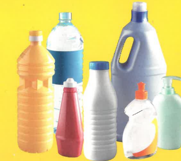
bouteilles / bidons / flacons