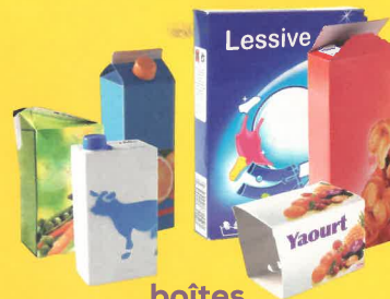
boîtes cartonnettes briques alimentaires