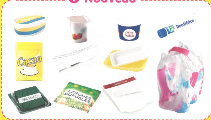
pots / barquettes / boîtes / sachets / films