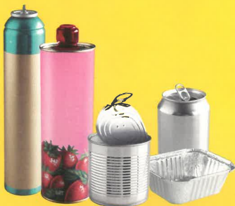
acier / aluminium